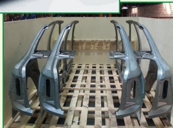
Тара № 289 ( под боковые части кузова )