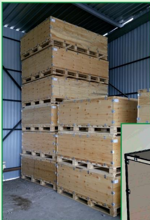
Складирование готовой продукции

Компания «АЗЛ» спроектировала и изготавливает тару для сборочных комплектов автомобилей по заказу альянса Renault-Nissan (АО "АВТОВАЗ"). Тара дерево-фанерная разработана под поставку морским путем в Северную Африку для серии Lada-Granta. Проект запущен в 2015 г. и успешно реализуется.