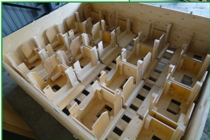
Тара № 278 ( под КПП )